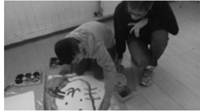
Impressionen des Mal- und Bastelangebots